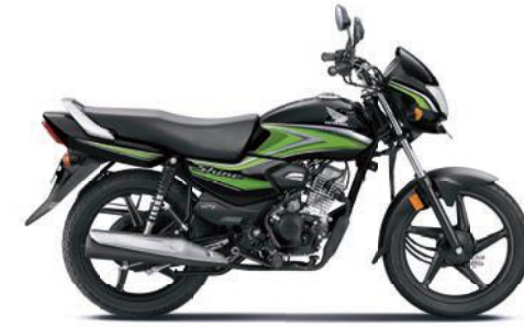
ग्रीन के साथ ब्लैक