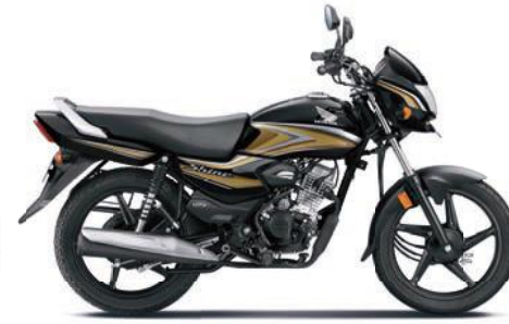
गोल्ड के साथ ब्लैक