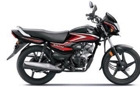
रेड के साथ ब्लैक