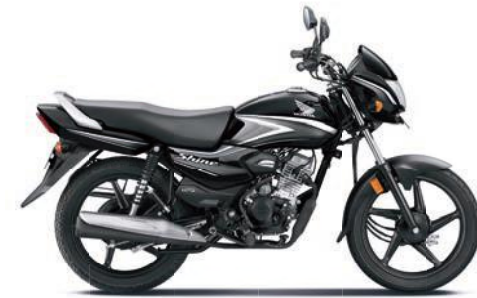
ग्रे के साथ ब्लैक

अभी ऑनलाइन बुक करें! www.honda2wheelerindia.com