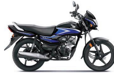
ब्लू के साथ ब्लैक